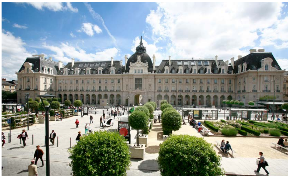
Ville de Rennes - Adeline Keil