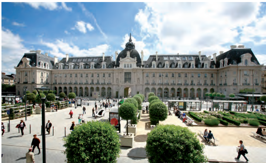
Ville de Rennes - Adeline Keil