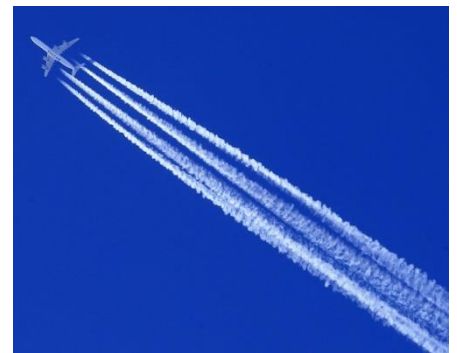
-Photo de traînées d'avions-